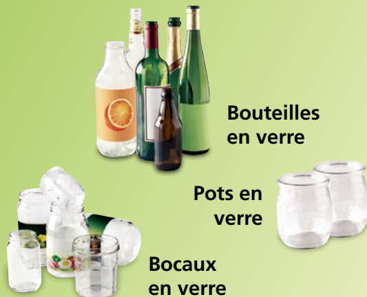
Bouteilles en verre