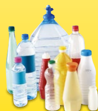
Boîtes et suremballages en carton