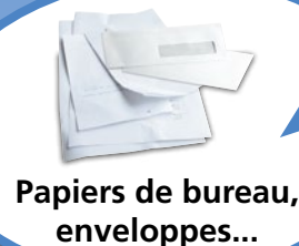
Papiers de bureau, enveloppes...