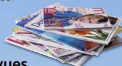
Revue et magazines