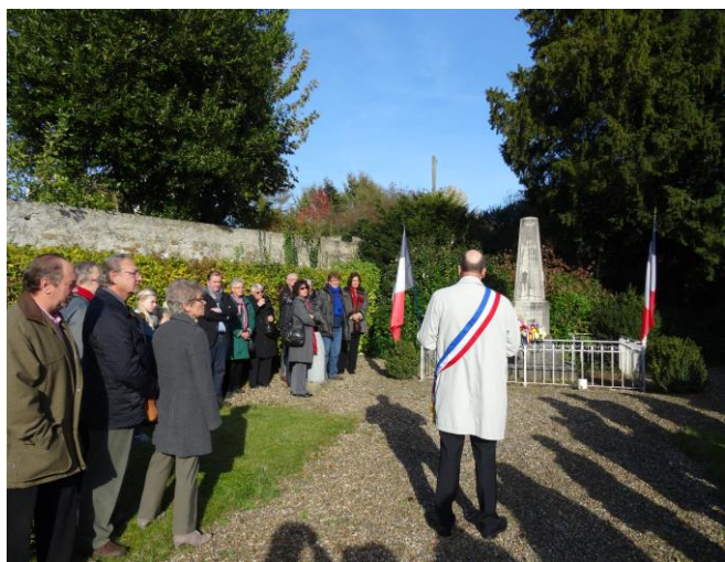
Discours au monument aux morts

Comme tous les ans, ce onze novembre, nous rendons hommage à ces braves qui ont combattu en nous réunissant autour du monument aux morts en souhaitant qu'il n'y en ait plu, de ces atrocités.