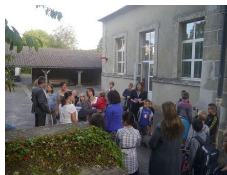
Rentrée à Wy