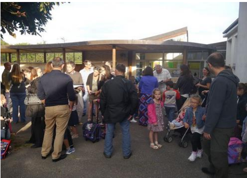
Rentrée à Arthies

Cette année, le Regroupement accueille 117 enfants répartis sur 5 classes.