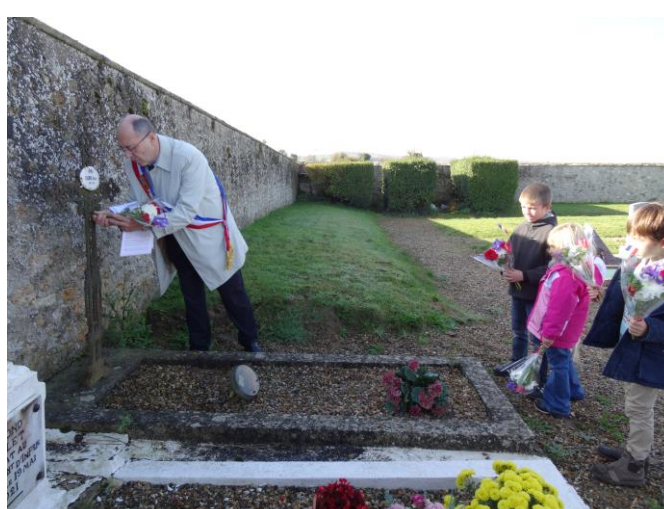
Dépot des bouquets sur les tombes des soldats