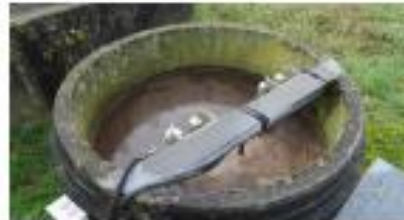
8- puits à boues

Les boues extraites du clarificateur sont dirigées vers un puits à boues.