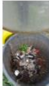
2- Le dégrillage

Première étape : Les eaux usées passent à travers un dégrilleur , une sorte de tamis, qui les débarrasse des matières grossières et inertes (chiffons, morceaux de bois, plastiques, feuilles,...).