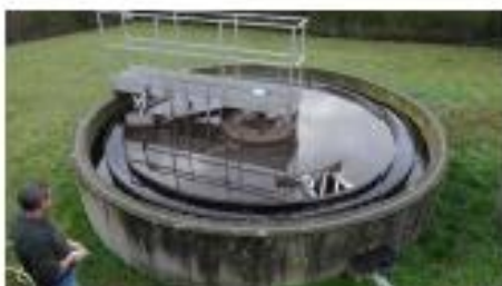
6- clarificateur : les boues produites lors du traitement biologique s'accumulent au fond, sont séparées de l'eau et seront dirigées vers le puits à boues. L'eau épurée restée en surface sera rejetée dans le Ru de Guiry