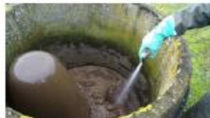
5- dégazeur : (par insufflation d'air) placé en amont du clarificateur, est un ouvrage qui permet une élimination des bulles contenues dans le mélange eau/boue. Ces bulles proviennent essentiellement de la formation de gaz au cours de l'oxygénation.