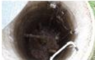
7- fosse de stockage des mousses et flottants.