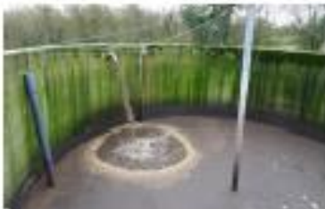
9- silo à boues

Puis par pompage, elles sont réinjectées vers le dégrilleur (bassin d'aération) ou vers le silo de stockage.