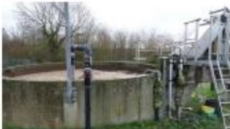
4- bassin d'aération : les matières organiques sont dégradées par des bactéries et deviendront des boues. Une forte concentration d'oxygène est entretenue au moyen d'aérateurs qui maintiennent la boue en suspension.

Le dessablage et le déshuilage-dégraissage consistent à faire passer l'eau dans des bassins où la réduction de vitesse d'écoulement fait se déposer les sables et flotter les graisses.