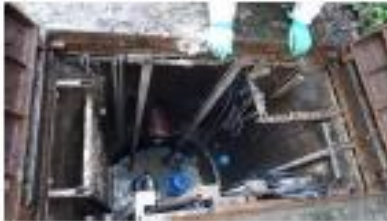
1- Le Poste de relevage où les eaux usées de Wy arrivent se trouve sur le chemin du moulin.

Voici le fonctionnement en images de la station de WY.