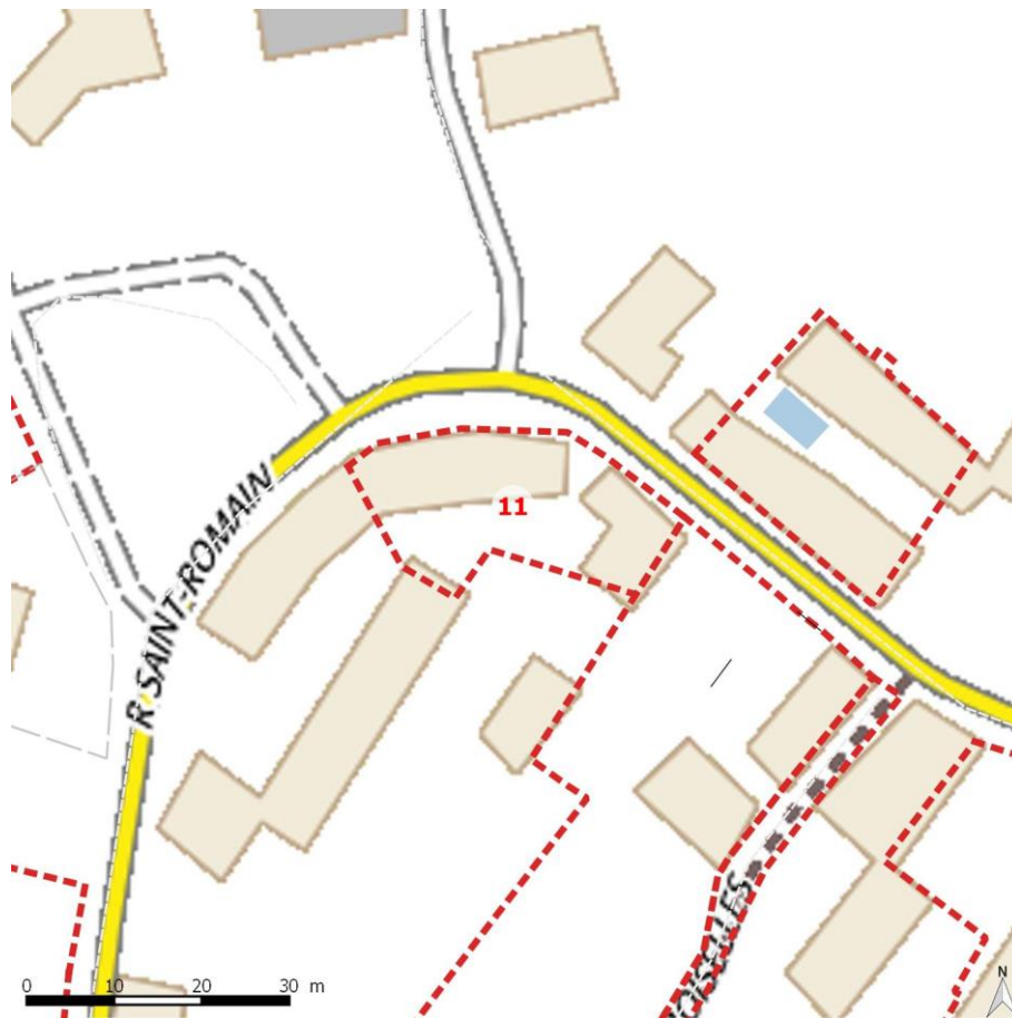
Extrait de la photo aérienne (Les numéros renvois aux numéros des bâtiments de la notice)