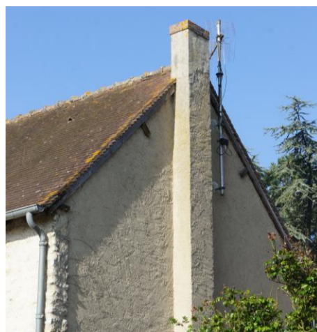
Cheminée en verrue sur pignon Nord