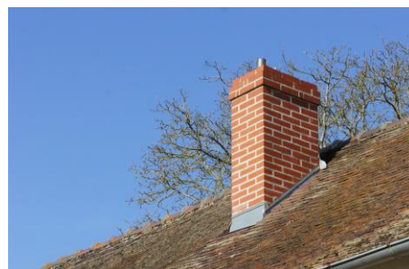
Cheminée brique rouge

Volet sur certaines baies, avec rails apparent.