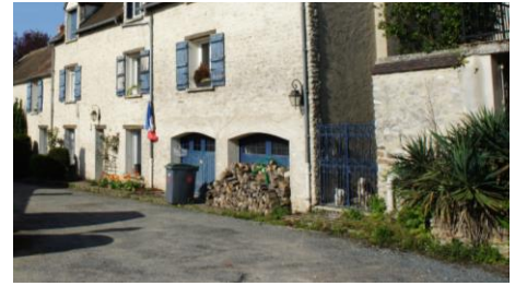
Pied de façade végétalisés – A valoriser