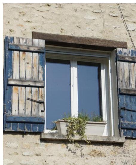
Volet roulant rail en saillie – Beurrage des pierres à l'enduit ciment