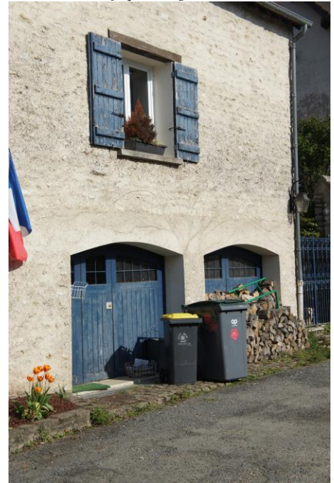
Menuiserie blanche et volet en bois bleu