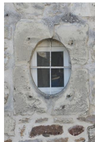
Œil de bœuf avec menuiserie rectangulaire

Menuiserie à bâtît et montant épais – menuiserie rectangulaire pour l'œil de bœuf.