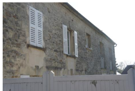
Bâtiment (3) – Façade Sud

Toutes les fenêtres de cette construction sont en PVC blanc. Des cheminées en pierre viennent couronner le toit en ardoises losanges.