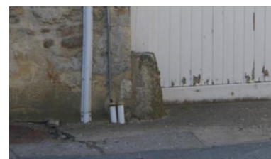
Pierre chasse roue