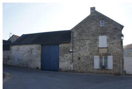
Pignon sur rue du bâtiment (3) – Façade sur rue du bâtiment (2)

Un deuxième bâtiment (2) est implanté perpendiculaire au premier ; il s'agit d'une grange, traversée par le « second accès ». Les élévations sont majoritairement en moellons de pierre calcaire à joints beurrés. Des chaînages verticaux en pierre de taille sont présents, notamment pour terminer les élévations du porche. La charpente est recouverte d'ardoises posées en losange.