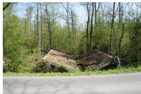
Lavoir vu depuis la route

D'emprise au sol carrée, un mur en moellons de pierre calcaire à joints beurrés s'élève sur l'un des côtés, tandis qu'à l'opposé et en partie médiane, on observe quatre poteaux carrés en bois, chacun posé sur un socle de pierre : c'est sur ces éléments que prend appui la couverture. Deux poutres métalliques reliant le mur et les poteaux permettent également d'ancrer les pannes en bois du toit. La toiture, en tuiles mécaniques, présente deux pans distincts qui se regardent, permettant ainsi de recueillir les eaux de pluie pour alimenter le bassin du lavoir. Ce dernier est lui-même bordé de carreaux à laver en pierre.