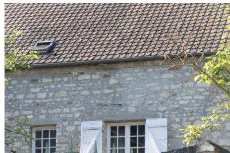
Beurrage des maçonneries du corps d'habitation (2)

Les couvertures en tuiles mécaniques à remplacer par des tuiles plates traditionnelles.