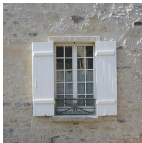
Baie type, entourée d'une maçonnerie remarquable

En cas d'installation d'équipement nécessitant des évacuations vers l'extérieur, ne pas réaliser ces sorties sur ou visible depuis l'espace public.