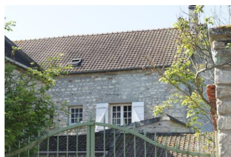
Façade du Corps d'habitation (2)