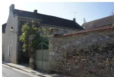
Portail en fer forgé (a) et mur de clôture