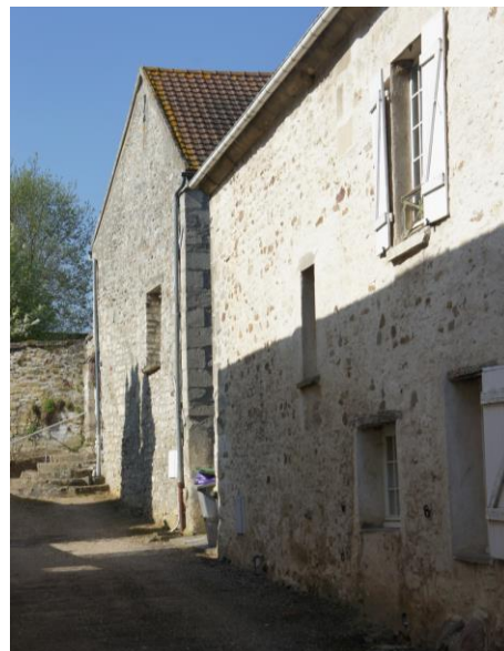
Premier plan : Façade corps d'habitation (1), second plan : Pignon corps d'habitation (2)

La propriété est close rue Saint-Romain par un mur en moellons de pierre calcaire, couvert de deux rangs de tuiles mécaniques ; le portail en fer forgé (a) s'appuie sur deux pilastres en pierre.