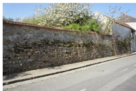
Les murs d'enceintes en moellons