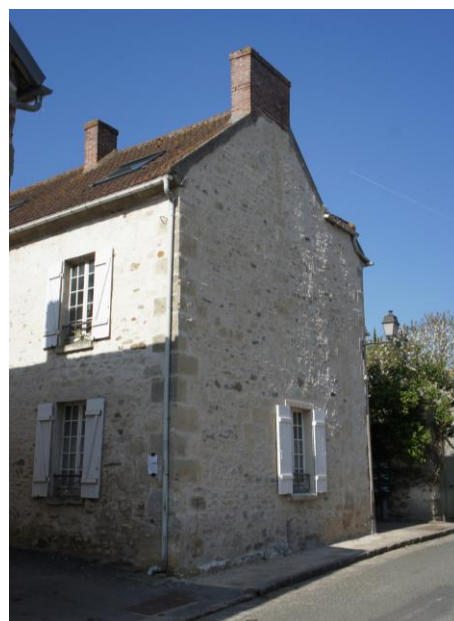
Corps d'habitation (1) – angle sente des Demoiselles et rue Saint Romain

Ce premier corps d'habitation (1) présente une composition R+1+C. Le pignon sur la rue bénéficie d'une fenêtre en rez-de-chaussée, agrémentée d'un appui de fenêtre en pierre, un encadrement en enduit, une menuiserie en bois blanc à petits bois, un garde-corps en fer forgé surmonté d'une traverse haute en bois, des volets battants en bois blancs. Ce pignon offre une construction en moellons de pierre calcaire à joints beurrés, avec des chaînages verticaux réalisés en pierres de taille au niveau du poinçon et des angles. Les autres façades sont de même composition, tant dans les maçonneries que les ouvertures.