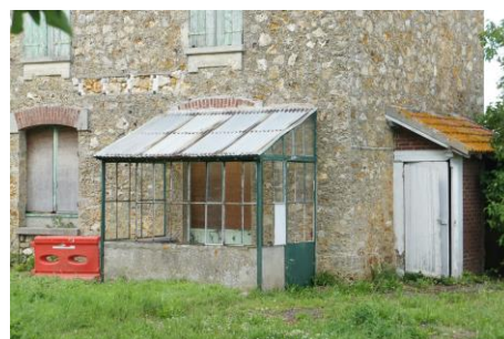
A gauche, verrière (3) – A droite, ancien sanitaire (4)