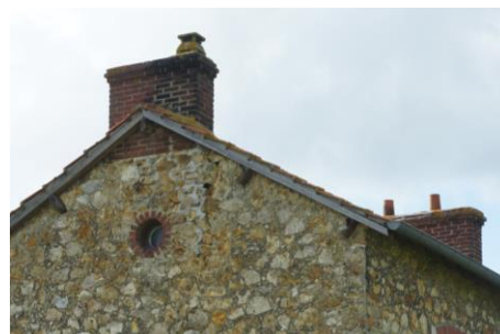
Cheminée de la gare

Lors de la rénovation il est impératif de garder une cohérence entre les matériaux en place et ceux utilisés pour la rénovation.