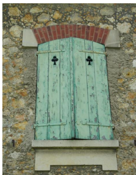
Baies types (à gauche baie du rdc, à droite baie de l'étage)