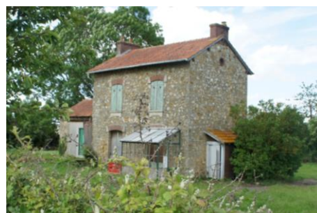
Gare – Volume (1)

Au rez-de-chaussée , une distinction apparaît en façade ouest avec la présence de la porte, dont la partie supérieure vitrée est aujourd'hui fermée par des pans de bois afin d'éviter les intrusions dans le bâtiment. On devine, que les menuiseries