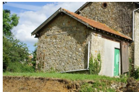
Espace marchandise – Volume (2)

Ce corps principal se prolonge au nord, par un second volume (2) , plus petit, d'un seul niveau, mais de même composition. Certainement voué au stockage, une large baie ponctuait chaque face, équipée d'un rail supérieur avec porte coulissante en bois, pour faciliter son usage. Le pignon aveugle garde les traces de l'ancienne plaque de gare.