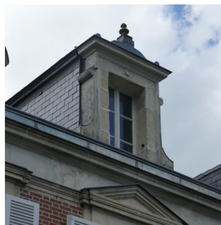
Lucarnes jacobines sur le toit de la mairie

– Les menuiseries en bois munis de petits bois et impostes.