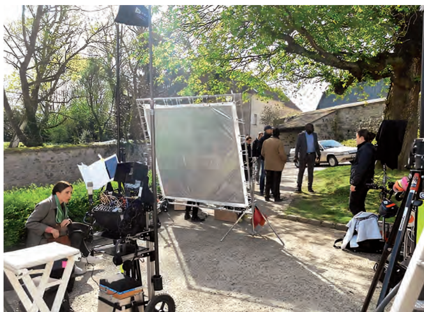
Tournage de Holly Weed en 2018

Quelques films tournés à Wy : « Un dimanche à la campagne » en 1984, un long dimanche de fiançailles en 2004, « Le parfum de la dame en noir » en 2005, « Mes héros » en 2012, « Un médecin de campagne » en 2016, une scène de Camping 3 en 2016, la série « Holly Weed », tournée à la mairie en 2018. Le village sert aussi de lieu de tournage pour des clips : celui d'Orelsan en 2016.