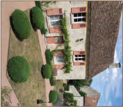
Jardin du musée de l'Outil

BALISAGE aucun DIFFICULTÉS : aucune À DÉCOUVRIR DANS LA RÉGION • Guiry-en-Vexin : musée archéologique du Val-d'Oise • Marnes : maison des arts et métiers de la Vigne • Sacy : musée de la Moisson • Théméricourt : maison du Parc et musée du Vexin français I • Office de tourisme Vexin Centre, 1 rue de la Croix des Vignes, 95640 Marnes, 01 30 39 68 84 • Parc naturel régional du Vexin français, Maison du Parc, 95450 Théméricourt, 01 34 48 66 00, contact@pnr-vexin-francais.fr • www.pnr-vexin-francais.fr • www.cdr95.com Comité du Val-d'Oise,