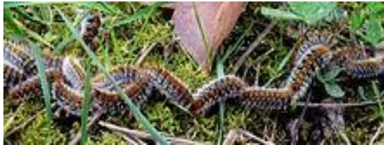
Une file peut compter quelques centaines de chenilles

Il ne faut surtout pas les toucher ou les écraser ou encore les balayer car même si la chenille est tuée, ses poils restent volatiles et urticants !